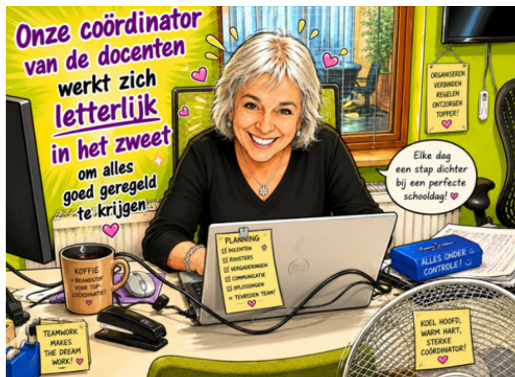
Foto is gemaakt met AI