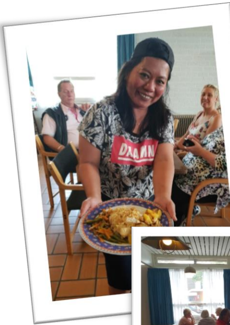
Eten met de Buren, locatie Blerick

Op locatie Blerick hebben ze elke week een aantal activiteiten. Er wordt taalles gegeven, Eten met de Buren, workshops en het taalcafé.